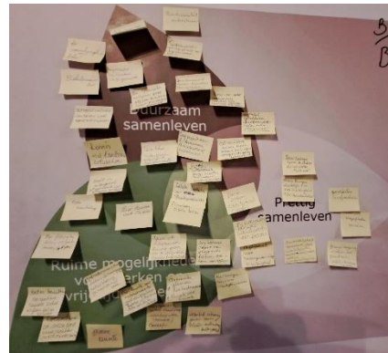
Figuur 3 Benutten