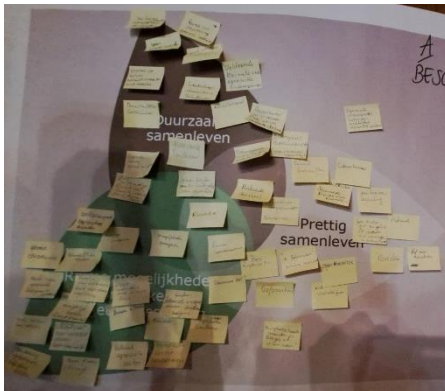
Figuur 2 Beschermen

Voor dit actieve gedeelte van de avond hebben we op drie flip-overs de drie ambities in de vorm van bladeren (zie figuur 1) geplakt. Daarboven stond het kernwoord geschreven (zie figuur 2, 3 en 4). We vroegen de deelnemers om op een post-it te schrijven wat zij willen beschermen in het buitengebied van de gemeente Rucphen. De deelnemers mochten daarna zelf bepalen bij welke ambitie op de flipovers zij hun post-it wilden plakken. Dezelfde oefening werd ook gedaan voor de kernwoorden benutten en ontwikkelen .