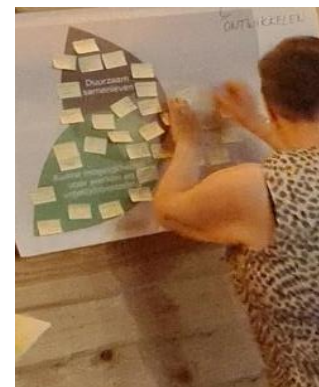
Figuur 4 Ontwikkelen

Het resultaat van de interactieve sessie I is dat we een beter beeld hebben van de opgaven in het buitengebied, maar dat we ook weten waar kansen liggen, waar we rekening mee moeten houden, wat fundamenteel is en wat we willen koesteren en beschermen. En dit hebben we voor alle drie de ambities uit de omgevingsvisie 1.0 (Duurzaam samenleven, Prettig Samenleven en Ruime mogelijkheden voor Werken en Vrijetijdsbesteding) opgehaald.