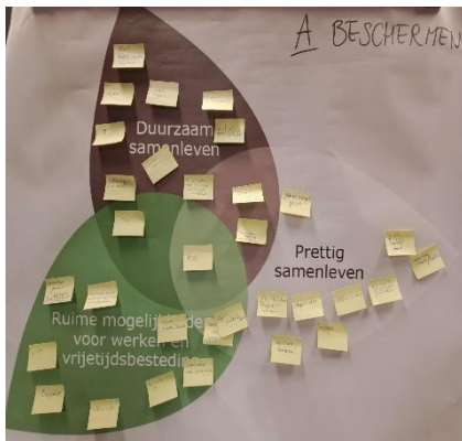
Figuur 2 Beschermen

Voor dit actieve gedeelte van de avond hebben we op drie flip-overs de drie ambities in de vorm van bladeren (zie figuur 1) geplakt. Daarboven stond het kernwoord geschreven (zie figuur 2, 3 en 4). We vroegen de deelnemers om op een post-it te schrijven wat zij willen beschermen in Rucphen. De deelnemers mochten daarna zelf bepalen bij welke ambitie op de flipovers zij hun post-it wilden plakken. Dezelfde oefening werd ook gedaan voor de kernwoorden benutten en ontwikkelen .