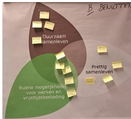
Figuur 3 Benutten