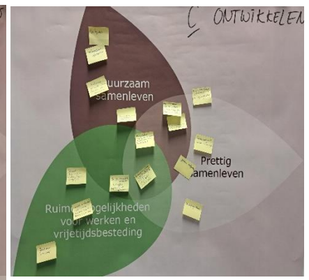
Figuur 4 Ontwikkelen

Het resultaat van de interactieve sessie I is dat we een beter beeld hebben van de opgaven in Rucphen, maar dat we ook weten waar kansen liggen, waar we rekening mee moeten houden, wat fundamenteel is en wat we willen koesteren en beschermen. En dit hebben we voor alle drie de ambities uit de omgevingsvisie 1.0 (Duurzaam Samenleven, Prettig Samenleven en Ruime mogelijkheden voor Werken en Vrijetijdsbesteding) opgehaald.