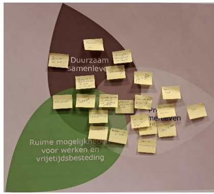
Figuur 3 Benutten