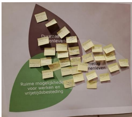
Figuur 2 Beschermen

Voor dit actieve gedeelte van de avond hebben we op drie flip-overs de drie ambities in de vorm van bladeren (zie figuur 1) geplakt. Daarboven stond het kernwoord geschreven (zie figuur 2, 3 en 4). We vroegen de deelnemers om op een post-it te schrijven wat zij willen beschermen in Zegge. De deelnemers mochten daarna zelf bepalen bij welke ambitie op de flipovers zij hun post-it wilden plakken. Dezelfde oefening werd ook gedaan voor de kernwoorden benutten en ontwikkelen .