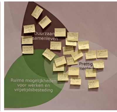
Figuur 4 Ontwikkelen

Het resultaat van de interactieve sessie I is dat we een beter beeld hebben van de opgaven in Zegge, maar dat we ook weten waar kansen liggen, waar we rekening mee moeten houden, wat fundamenteel is en wat we willen koesteren en beschermen. En dit hebben we voor alle drie de ambities uit de omgevingsvisie 1.0 (Duurzaam Samenleven, Prettig Samenleven en Ruime mogelijkheden voor Werken en Vrijetijdsbesteding) opgehaald.