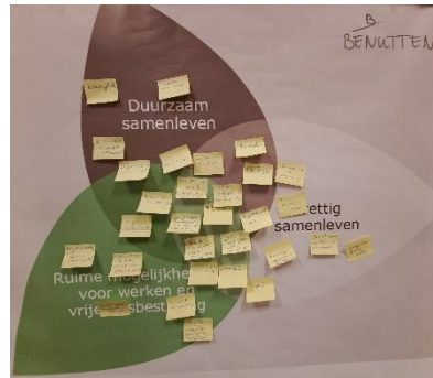
Figuur 3 Benutten