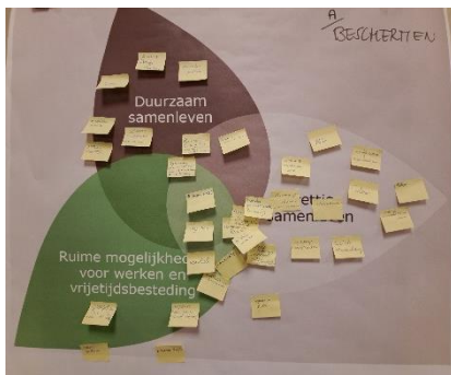
Figuur 2 Beschermen

Voor dit actieve gedeelte van de avond hebben we op drie flip-overs de drie ambities in de vorm van bladeren (zie figuur 1) geplakt. Daarboven stond het kernwoord geschreven (zie figuur 2, 3 en 4). We vroegen de deelnemers om op een post-it te schrijven wat zij willen beschermen in St. Willebrord. De deelnemers mochten daarna zelf bepalen bij welke ambitie op de flipovers zij hun post-it wilden plakken. Dezelfde oefening werd ook gedaan voor de kernwoorden benutten en ontwikkelen .