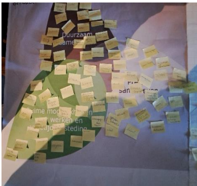
Figuur 2 Beschermen

Voor dit actieve gedeelte van de avond hebben we op drie flip-overs de drie ambities in de vorm van bladeren (zie figuur 1) geplakt. Daarboven stond het kernwoord geschreven (zie figuur 2, 3 en 4). We vroegen de deelnemers om op een post-it te schrijven wat zij willen beschermen in Schijf. De deelnemers mochten daarna zelf bepalen bij welke ambitie op de flipovers zij hun post-it wilden plakken. Dezelfde oefening werd ook gedaan voor de kernwoorden benutten en ontwikkelen .