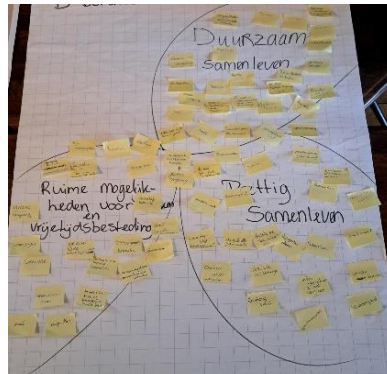
Figuur 3 Benutten