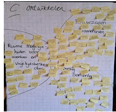
Figuur 4 Ontwikkelen

Het resultaat van de interactieve sessie I is dat we een beter beeld hebben van de opgaven in Schijf, maar dat we ook weten waar kansen liggen, waar we rekening mee moeten houden, wat fundamenteel is en wat we willen koesteren en beschermen. En dit hebben we voor alle drie de ambities uit de omgevingsvisie 1.0 (Duurzaam Samenleven, Prettig Samenleven en Ruime mogelijkheden voor Werken en Vrijetijdsbesteding) opgehaald.